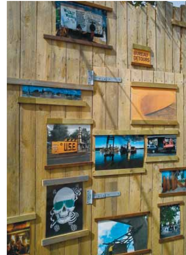
Herover og t.v.: På arealet foran Prismen blev der samtidig arbejdet kreativt som en del af Metropolis-festivalen for kunst og performance i byens rum.

Knaster og medalje-bagsider til trods er Givrum.nu et sympatisk initiativ, der forsøger – og har held med – at få umage par til at mødes med det formål at skabe maksimalt udbytte og tilfredshed for alle parter. Samtidig vises der positive takter fra Københavns Kommunes side, når det gælder ønsket om at øge lydhørheden og fleksibiliteten overfor de initiativer, der ikke per automatik kan passes ind i en eksisterende ramme. Derfor kan man håbe, at der også findes positive løsninger på de indbyggede problematikker, som midlertidig ibrugtagning af bygninger rummer. Indtil da må man glæde sig over alle de kreative energier og skæve indslag, byen har haft glæde af undervejs. < vs!