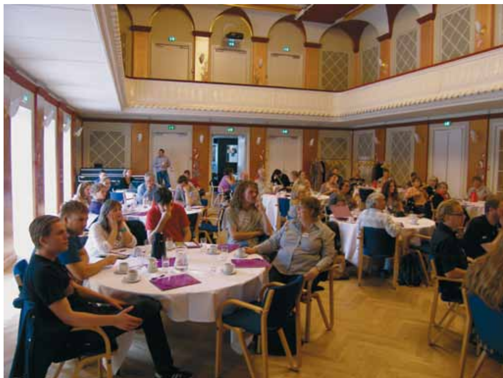
Årets hustræf fandt sted i Borgerforeningens smukke nyrestaurerede Guldsal

Derudover forsøger de ansatte at spille på flere tangenter i arbejdet, og man har således både oprettet en tænketank med særligt inviterede deltagere, holdt open space møder og lavet video-blogs på nettet - samtidig med at man er i daglig kontakt med brugerne, forholder sig lyttende og indtager en faciliterende rolle. I sidste ende handler det lige så meget om at finde noget at mødes omkring, som både brugerne og de ansatte brænder for. En af husets største succeser er en årlig brugerinitieret nytårskur, der tiltrækker op mod 1000 mennesker, som primært kommer for at møde hinanden og få talt sammen.