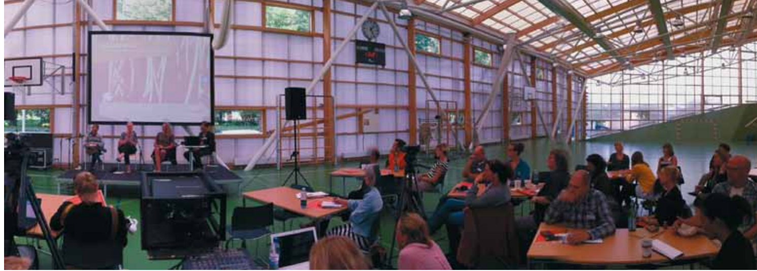
En del af programmet for Think Space fandt sted i den store sal i sportshallen Prismen, der er en del af Amagerbro Kultur.