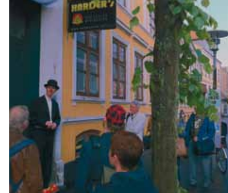
Deltagerne kunne besøge Kulturhuset Harmonien og spillestedet Harders og samtidig opleve en snert af den årlige klovnefestival.